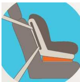
Лицом по ходу движения