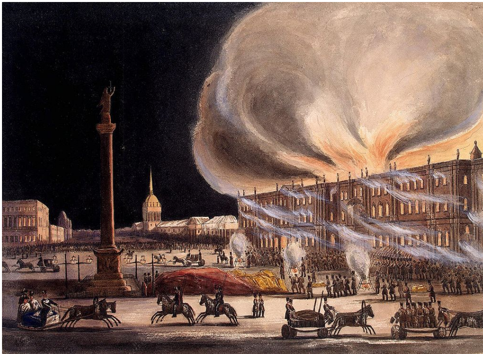
Пожар в Зимнем дворце 17 декабря 1837 года. Художник Б. Грин

Задание: как вы думаете, какие изменения были предприняты в новом проекте здания, для того, чтобы уберечь его от повторения беды? Приведите не менее трех пунктов. Аргументируйте свой ответ.