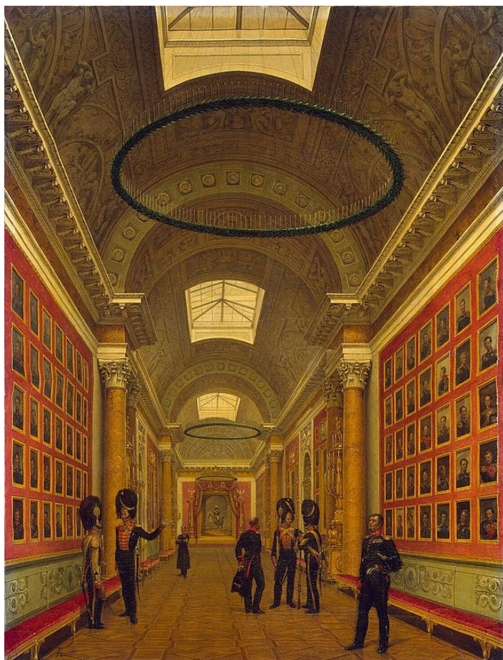
Г. Чернецов, 1827